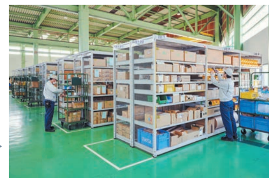
工場内の2か所に保管場所が分散。ピッキング作業は、倉庫内の棚から棚へ歩き回って必要な部品を探し集めていました。